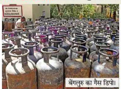
बंगलुरु का गैस डिपो

मम, कमर्शियल सिलेंडर की कमी 9 मार्च से कमर्शियल एलपीजी वितरण बंद है, केवल अस्पताल-स्कूलों को छूट मिली है। वितरण केन्द्रों पर लंबी कतारें गिस्तक होने पर भी सिलेंडर नहीं दे रहे। दिल्ली-एनसीआर, मेन्सू में कटौती कर्नाट प्लेस के व्यापारी बिजली के उपकरण खरीदने पर विचार कर रहे हैं, दिल्ली-एनसीआर, मेन्सू में कटौती कर्नाट प्लेस के व्यापारी बिजली के उपकरण खरीदने पर विचार कर रहे हैं, पाइपड गैस का दबाव 20% से घटकर 18% हो गया है। मेन्सू बदलने पड़ रहे। कर्नाटक, होटल-रेस्त्रां पर संकट, 9 मार्च से IOCL, HPCL और BPCL तीनों कंपनियों की कमर्शियल एलपीजी आपूर्ति यहां अचानक बंद हो गई। तमिलनाडु, छोटे व्यापारी मुश्किल में कमर्शियल एलपीजी बंद होने से हजारों छोटे व्यापारी, आईटी कैंटीन, बैंकेट हॉल व पर्यटन सेवाएं प्रभावित हैं। खाने के उतेले बचे स्टॉक से काम चला रहे हैं।