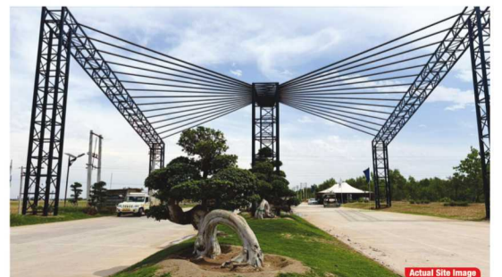
Actual Site Image

आज के दौर में वही प्रोजेक्ट आगे बढ़ते हैं, जो तेज़ी से काम करें, मजबूत इंफ्रास्ट्रक्चर दें और भविष्य की जरूरतों को ध्यान में रखें। एमआईजेड (MIEZ) इन तीनों पहलुओं पर खरा उतरता है। यह सिर्फ जमीन नहीं, बल्कि एक ऐसा तैयार और भरोसेमंद इंडस्ट्रियल माहौल देता है, जहां बिजनेस आसानी से शुरू होकर आगे बढ़ सकता है। जो कंपनियां और निवेशक एक ऐसे स्थान की तलाश में हैं, जहां सब कुछ पहले से तैयार हो और विकास की पूरी संभावना हो, उनके लिए MIEZ एक मजबूत और सही विकल्प बनकर उभर रहा है।