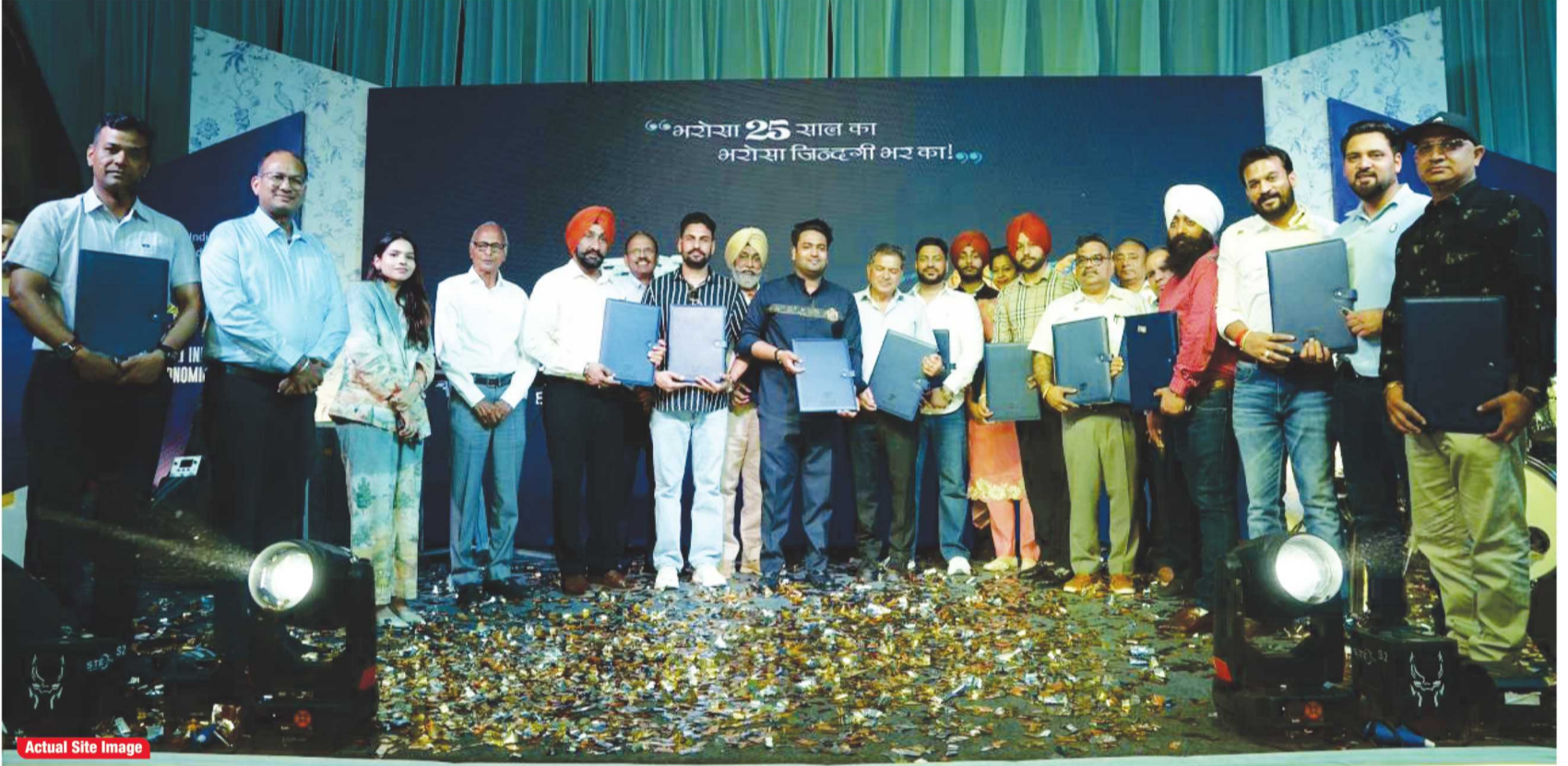
Actual Site Image

3 त्र भारत में इंडस्ट्रियल डेवलपमेंट अब एक नए दौर में प्रवेश कर रहा है जहां केवल प्लानिंग नहीं, बल्कि तेज़ काम, मजबूत इंफ्रास्ट्रक्चर और तुरंत उपयोग की सुविधा ज्यादा अहम हो गई है। इस बदलते माहौल में मोहाली इंडस्ट्रियल इकोनॉमिक ज़ोन (MIEZ) एक मजबूत उदाहरण बनकर सामने आया है, जो सिर्फ वादे नहीं, बल्कि ज़मीन पर काम करके दिखा रहा है।