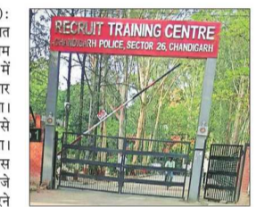
नोटिफिकेशन में उम्र का जिक्र नहीं किया था।