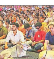
कथा सुनते श्रद्धालु।