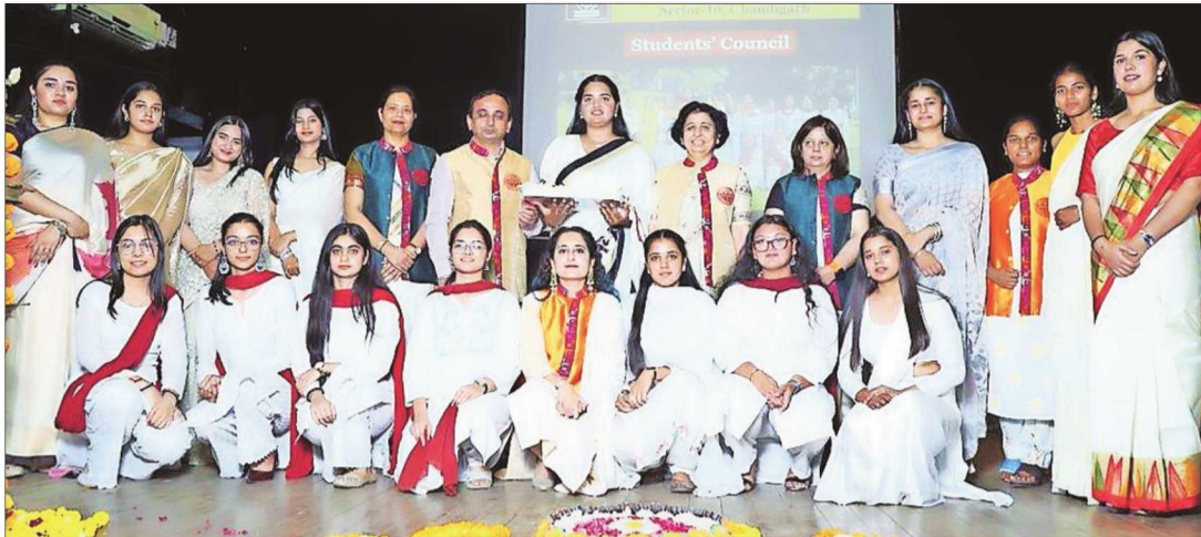
गवर्नमेंट होम साइंस कॉलेज सैक्टर-10 चंडीगढ़ में आयोजित 55वां दीक्षांत समारोह आयोजित हुआ, जिसमें स्टूडेंट्स को उनकी उपलब्धियों और डिग्रियां देकर सम्मानित किया गया।