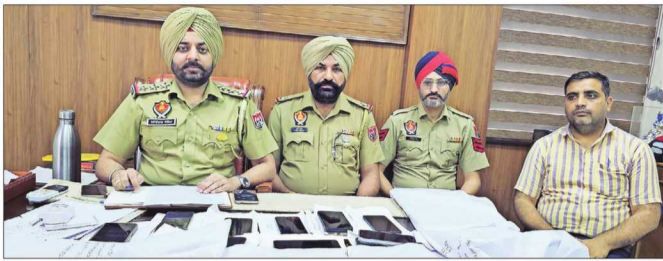
जीरकपुर पुलिस थाना प्रभारी प्रैसवातां दौरान जानकारी देते हुए।