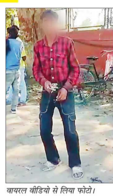
वायरल वीडियो से लिया फोटो।

युवक सड़क किनारे फुटपाथ पर खड़ा है। उसके आसपास 10 से 15 लोग बैठे हैं और कुछ वहां से गुजर भी रहे हैं। युवक की आंखें बंद और मुंह खुला हुआ है। एक हाथ में बीड़ी है, लेकिन शरीर में कोई मूवमेंट नहीं है।