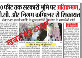
20 फीट तक सरकारी भूमि पर अतिक्रमण, डी.सी. और निगम कमिश्नर से शिकायत

चंडीगढ़, 18 अप्रैल (रॉय): सैक्टर-22 शारुजी मार्केट में 20 फीट तक सरकारी भूमि पर अतिक्रमण को नगर निगम एनफोर्समेंट विभाग की टीम ने हटा दिया। इसके साथ-साथ एनफोर्समेंट टीम ने अन्य बूधस द्वारा अतिक्रमण को हटाया और चालान कर समान भी जब्त किया। मार्केट में दीवारों पर कब्जा कर सामान सजाने वालों के भी चालान कर समान जब्त किया। इसके अतिरिक्त रास्ते के किनारे सामान रखकर बेचने वालों के भी चालान किए गए। कार्रवाई के दौरान कुछ बूध वालों ने संबंधित निगम इंस्पेक्टर को भी धमकी दी। धमकी की पुष्टि करते हुए इंस्पेक्टर ने बताया कि समय-समय पर वे बूध और बेंडर्स द्वारा अतिक्रमण को हटवाते रहते हैं, लेकिन पुनः वही अतिक्रमण कर लेते हैं। शनिवार को जब वे अतिक्रमण हटवा रहे थे तो कुछ बूध मालिकों ने