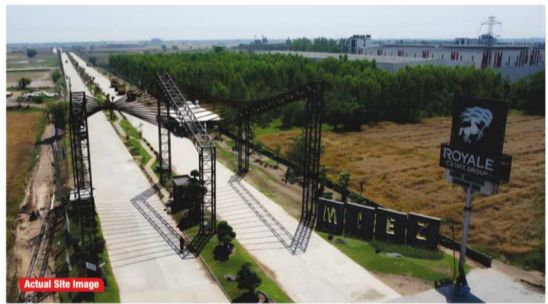
Actual Site Image

मजबूत इंफ्रास्ट्रक्चर, अच्छी लोकेशन और तेज़ डिलीवरी के चलते एमआईजेड (MIEZ) में विभिन्न इंडस्ट्रीज की दिलचस्पी तेज़ी से बढ़ रही है। यह प्रोजेक्ट MSMEs, मिड-साइज कंपनियों और बढ़ते उद्योगों के लिए उपयुक्त है। यहां 500 वर्ग गज से लेकर 5 एकड़ तक के प्लॉट उपलब्ध हैं, जिससे कंपनियां अपनी जरूरत के हिसाब से जगह चुन सकती हैं और भविष्य में विस्तार भी कर सकती हैं।