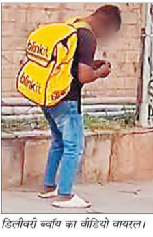
डिलीवरी बॉय का वीडियो वायरल।

लगभग एक माह पहले मार्च माह में आया था पहला केस सामने डिलीवरी बॉय घंटों खड़ा रहा था