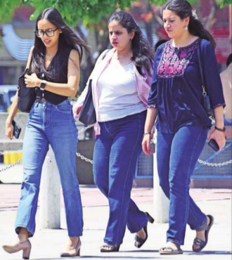
दिन के समय तापमान बढ़ने लगा है, लेकिन सुबह-शाम की ठंड अभी भी बरकरार है।

पिछले कुछ दिनों से उत्तर भारत के मैदानों में बढ़ रहे तापमान के बीच शनिवार को इस साल में पहली बार तापमान 40 डिग्री को पार कर गया। हालांकि, एक रोज पहले 20 डिग्री से नीचे नहीं रहे रात के न्यूनतम तापमान में शुक्रवार रात गिरावट आई लेकिन आने वाले दिनों में अब लोगों को बढ़ते तापमान के बीच गर्मी से बचाव के इंजीनियर करने ही होंगे। आने वाले दिनों में कोई ऐसा सिस्टम भी नहीं बन रहा है जो अब लगातार बढ़ते वाले तापमान को रोकने में मदद करे।