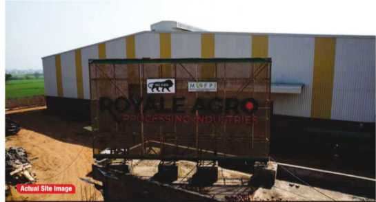
Actual Site Image

इन सड़कों की गुणवत्ता इसे और खास बनाती है। 2.5 फीट गहराई तक बनी इन