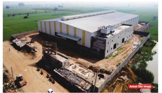
Actual Site Image

इसके अलावा, 100 एकड़ में एक प्रीमियम रेजिडेंशियल टाउनशिप भी प्लान की गई है, जहां 1000 वर्ग गज तक के बड़े प्लॉट और आधुनिक सुविधाएं दी जाएंगी।