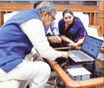
हरियाणा के राज्यपाल ऑनलाइन जनगणना पोर्टल पर अपनी स्वगणना पूरी की।