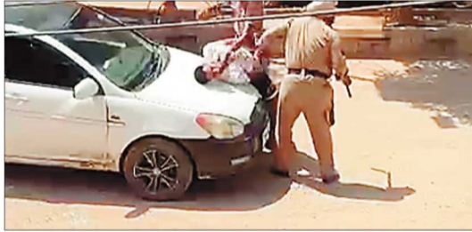
वायरल वीडियो में पुलिस कर्मचारी कार के बोन्ट पर आरोपी को पीटते हुए।