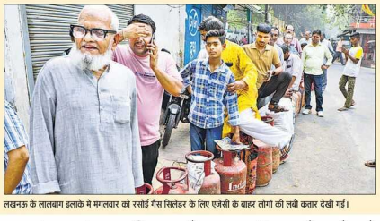
सुरक्षा के तहत गैस इस्तेमाल के लिए एसी के बाहर लोगों की लंबी कतार देखी गई।

मध्यपूर्व में जंग (नई दिल्ली) - मध्यपूर्व क्षेत्र में तेल की आपूर्ति में कटौती के कारण अनेक उद्योगों को आपूर्ति में कटौती होगी। सरकार बोली-सीएनजी और पीएनजी की कमी नहीं, उद्योगों को आपूर्ति में कटौती होगी।