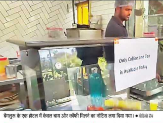
मैंगलूक के एक होटल में ठंडक चाय और कॉफी मिलने का नॉटिस बना दिया गया।

सांसत नई दिल्ली, एजेंसी। आंध्र प्रदेश और उत्तराखण्ड को लेकर ये युद्ध को नजर से देखने के कई हिस्सों में एलपीजी की किल्लत की आशंका से लोगों में घबराहट है। उत्तर प्रदेश, गुजरात, दिल्ली, कर्नाटक, पश्चिम बंगाल, राजस्थान सहित कई राज्यों में एलपी गैस की लंबी कतारों की शिकायतें बनी रह रही हैं। कई राज्यों में एलपी गैस की लंबी कतारों को नजर में रखते हुए एलपी गैस की आपूर्ति को बढ़ा देने का प्रयास हो रहा है।